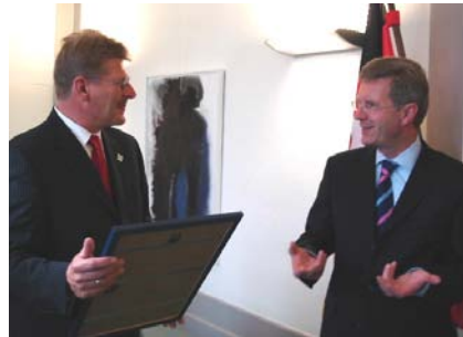
Preisträger Ministerpräsident Christian Wulff

Lackschichtdickenmessgerät. In Anlehnung an den Kennedy-Spruch: „Würden Sie von diesem Politiker einen Gebrauchtwagen kaufen“ wählen die freien Kfz-Händler einen Politiker zum möglichen Vertreter in ihrem Autohaus. Preisträger waren bisher unter anderem Friedrich Merz, Guido Westerwelle und Christian Wulff.