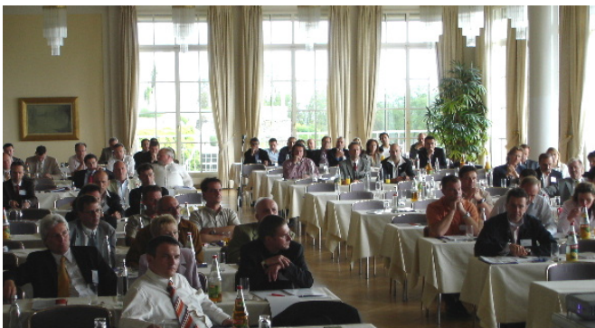
Kräftebündelung: BVfK - der Zusammenschluss freier Kfz-Händler

So wurde der BVfK zur kompetenten Fachvertretung einer Branche mit Zuwachsraten und gesunden Erträgen.